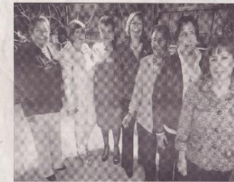
La nueva directiva fue posesionada.

El programa de posesión de la nueva directiva de la Asociación de Mujeres de Negocios y Profesionales "BPW Ambato" se desarrolló el viernes ocho de julio.