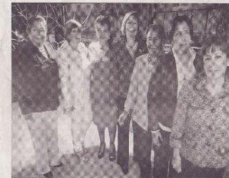
La nueva directiva fue posesionada.

El programa de posesión de la nueva directiva de la Asociación de Mujeres de Negocios y Profesionales "BPW Ambato" se desarrolló el viernes ocho de julio.