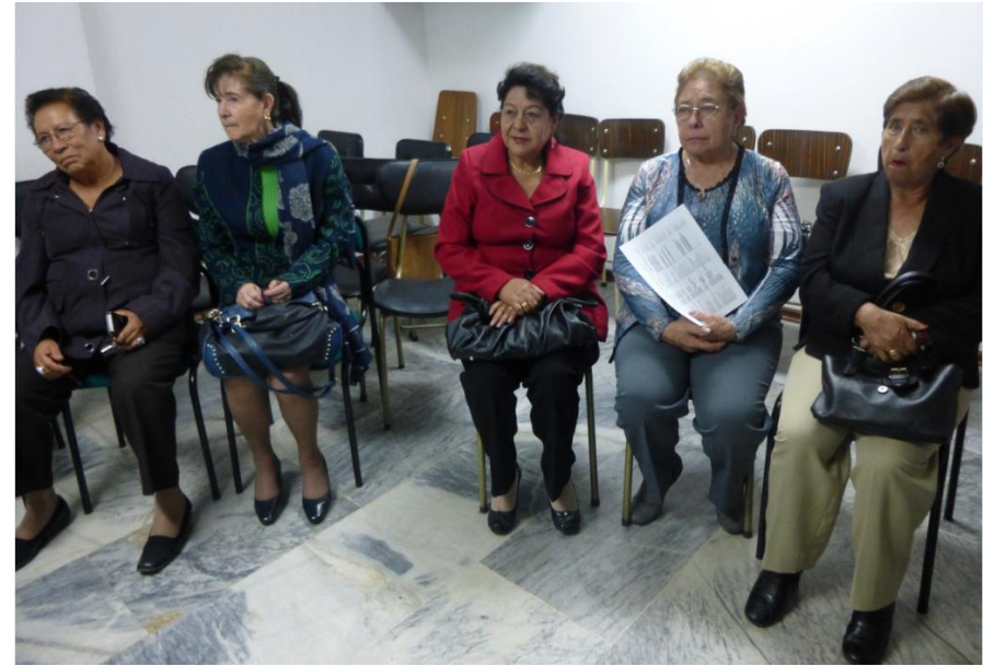
La FEDERACIÓN atiende las sugerencias