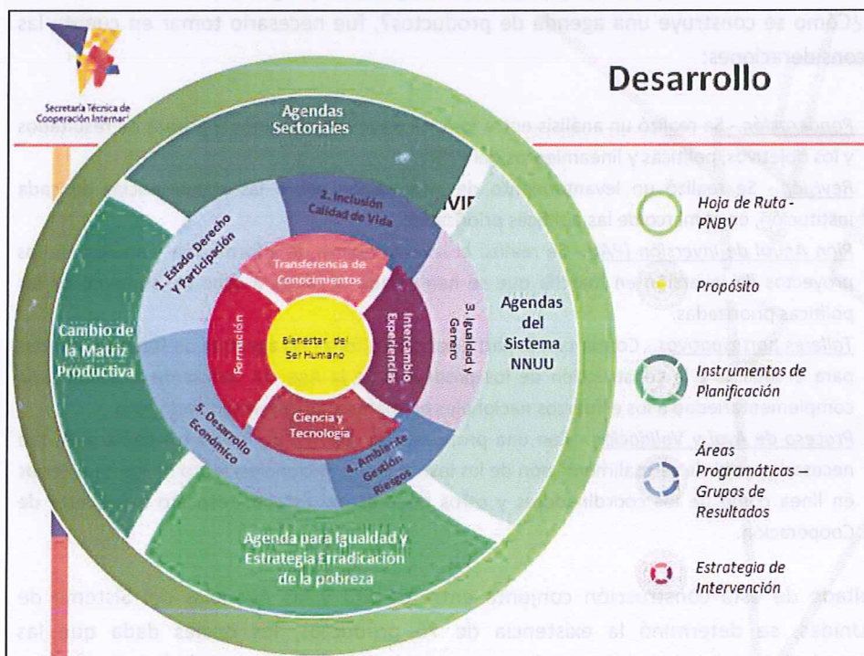
Gráfico 1. Construcción metodológica del UNDAF